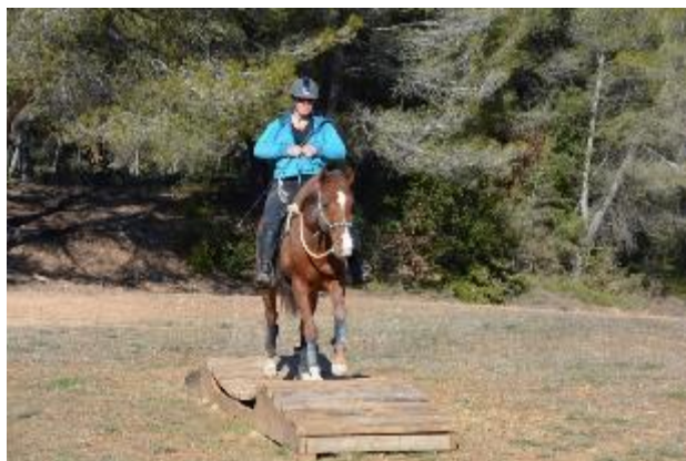
Roméo sur un pont suspendu

A cette occasion, buvette et petite restauration vous seront proposées au profit de L'Amicale de St Jean.